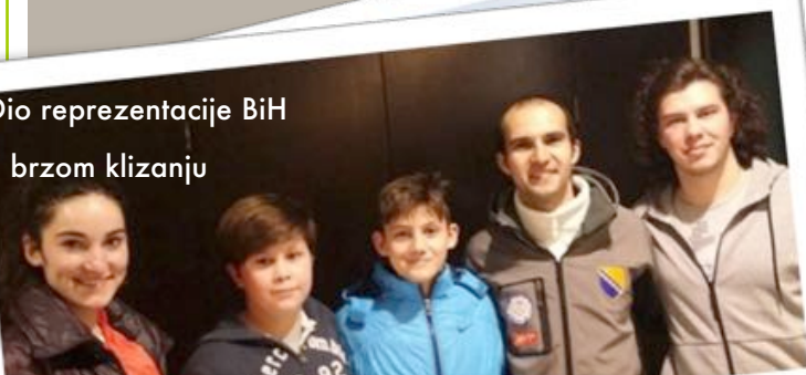
Dio reprezentacije BiH u brzom klizanju